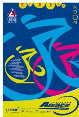
L'affiche officielle du Tour Alsace 2007, réalisée par D. SALTZMANN, Directeur Artistique chez AUJOURD'HUI

... nous indique le chronomètre de la page d'accueil de notre site www.touralsace.fr ; soit le temps restant avant le lancement du Tour Alsace 2007. Dans quelques mois, le premier départ sera sifflé à Sausheim, annonçant six jours de compétition sportive et de festivités. Chez AUJOURD'HUI Groupe LARGER, les Organisateurs travaillent depuis plusieurs semaines sur la course : les étapes sont posées et l'affiche officielle sera prochainement dévoilée au grand public. Il faut dire que 2007 est une année particulière : le Tour Alsace est passé en catégorie UCI Europe Tour , et l'on programme ses vacances d'été depuis les quatre coins de la France pour assister à une étape !